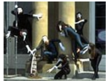
Tanzende Erde + Erdgeister – Groß-Inszenierung für Carmina Burana , Neues Schloß Stuttgart – 1996: 2 Chöre, Symphonie-Orchester, + intern. Gruppen