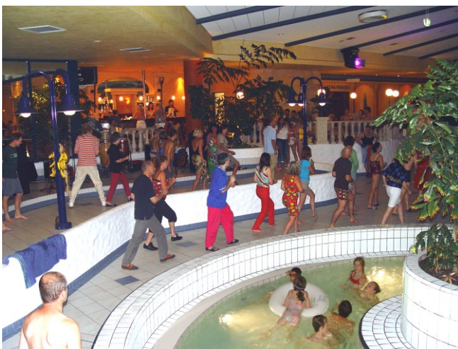
Rhein-Main-Therme Hofheim 2004-2005, Fr., 19-23h: Therme Tropical Tanzen + Baden (zum Teil zu Live-Musik) - Workshop + Party