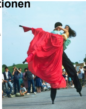
Tanz auf Stelzen seit 1984: Ab 2010 verstärkt Karibik- Stelzentanz + Stelzenfeste