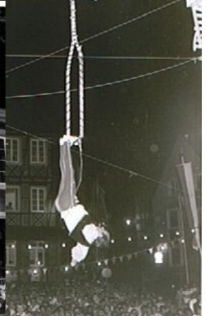
Circus-Projekt (Vereinsring) Stadt Ettenheim 1987 + 89: 120 Artisten aus Sport- + Musikvereinen, Schulen + Kindergarten – auch an Hochseil + Hänge-Perche