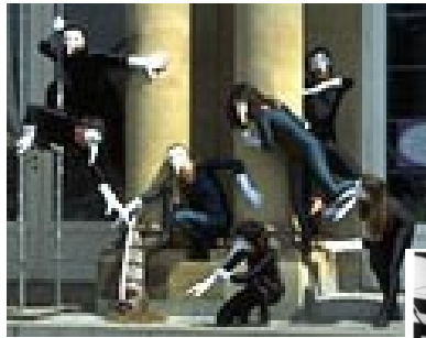
Carmina Burana Projekt Stuttgart , 1996 Neues Schloß - mit internat. Artisten, 2 Chören, Symphonie- Orchester und meinen Erdgeisern.