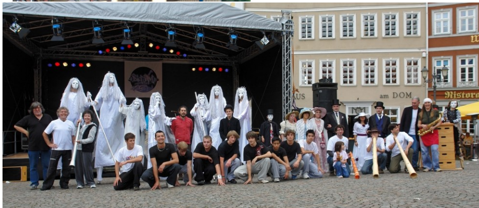
Domplatz Show-Spektakel Brückenfest Wetzlar 2008 – 65 Mitwirkende (Musiker, Artisten, Tänzer, Turner, Parkour, Stelzen, Kostümgruppe).