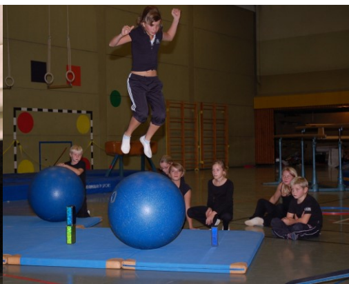
BewegungsART-Spektakulum Solms - Ferien- Projekt Turngau Lahn-Dill 2006 - mit Leiter- + Kugel- Akrobatik, Fly-Jump/-Dance, Masken, Stelzen, Partner-, Tisch-, Sprung-, Einrad- + Trapez-Akrobatik, Lebenden Puppen, Luftshows