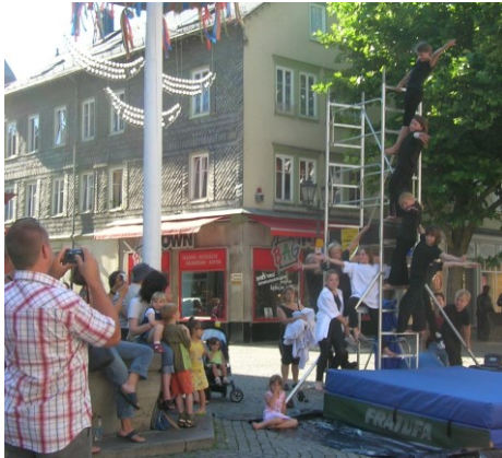
Akrobatik-Gerüst in Herborn und Ober-Mörlen 2007 - Marktplatz- und Fest- Show-Projekte zum Mitmachen, auch als Bühnenteil nutzbar.

u.a. in Zusammenarbeit mit Vereinen, Gruppen und Initiativen (Sport, Musik, Kultur), Gewerbeingen, Festorganisationen Zu meinem besonderen Schwerpunkten Stelzen- oder Leiter-Fest-Projekte / -Shows bitte die speziellen Projekt-Foto-Seiten erfragen.