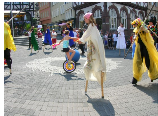
Straßen-Fest-Show /-Projekt mit Stelzen + Artistik-Kids Kulturtage Wetzlar 2007-06.